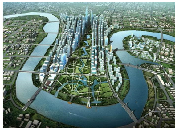
Thu Thiem New Urban Area Plan