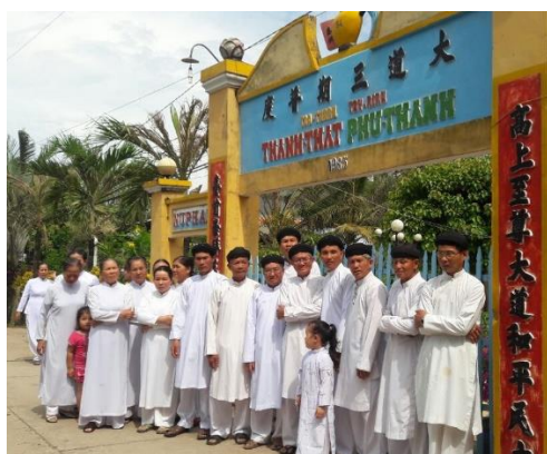
Photo 01: Adherents of the Independent Church from other locations arrived on March 19, 2017.