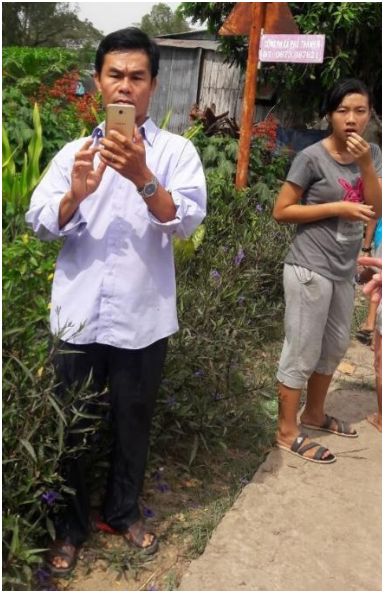
Photo 02: Plainclothes policemen took pictures and video recordings of visiting adherents of the Independent19. 03. 2016.