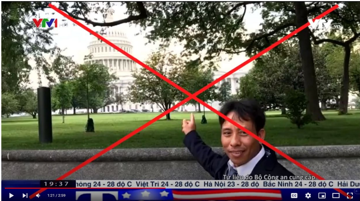
VTV1 thời sự lúc 19:36 ngày 8/10/2022 phủ nhận tình trạng đàn áp tôn giáo