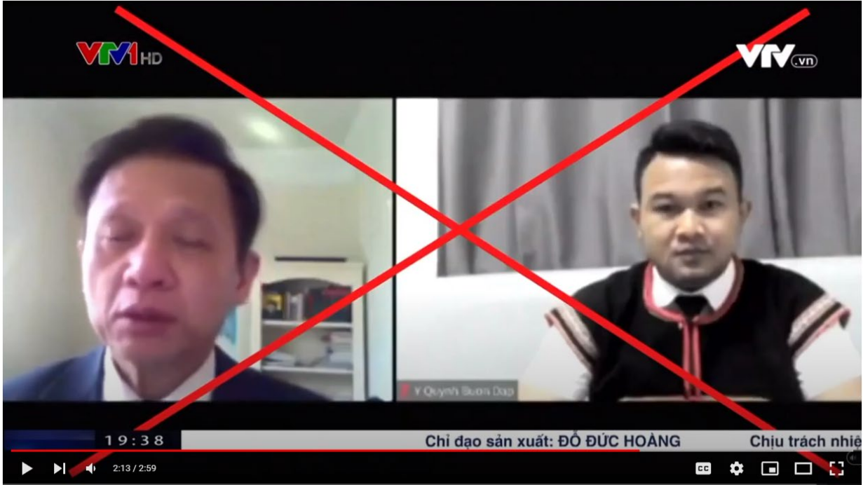
VTV1 thời sự lúc 19:36 ngày 8/10/2022 phủ nhận tình trạng đàn áp tôn giáo