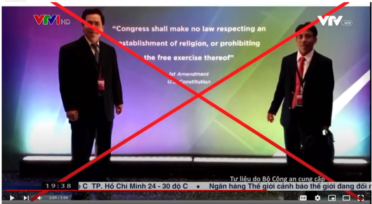
VTV1 thời sự lúc 19:36 ngày 8/10/2022 phủ nhận tình trạng đàn áp tôn giáo