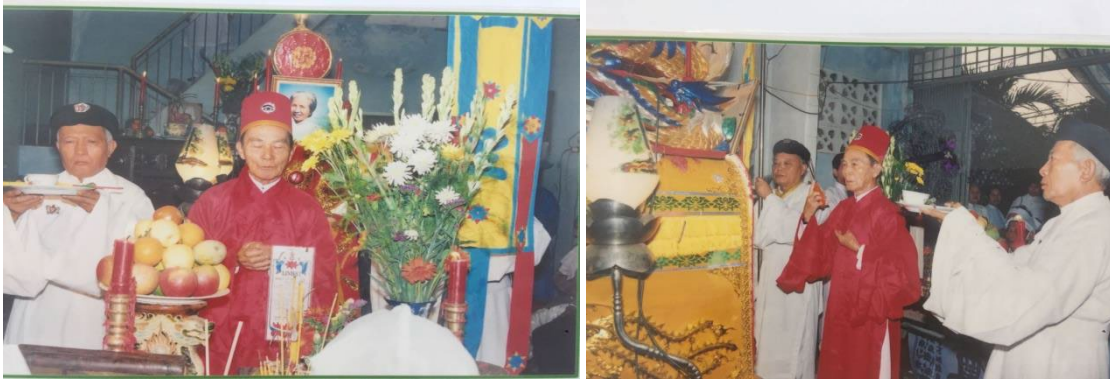
Cao Dai followers and clerics forced to conduct religious activities at a makeshift place of worship located in a private home