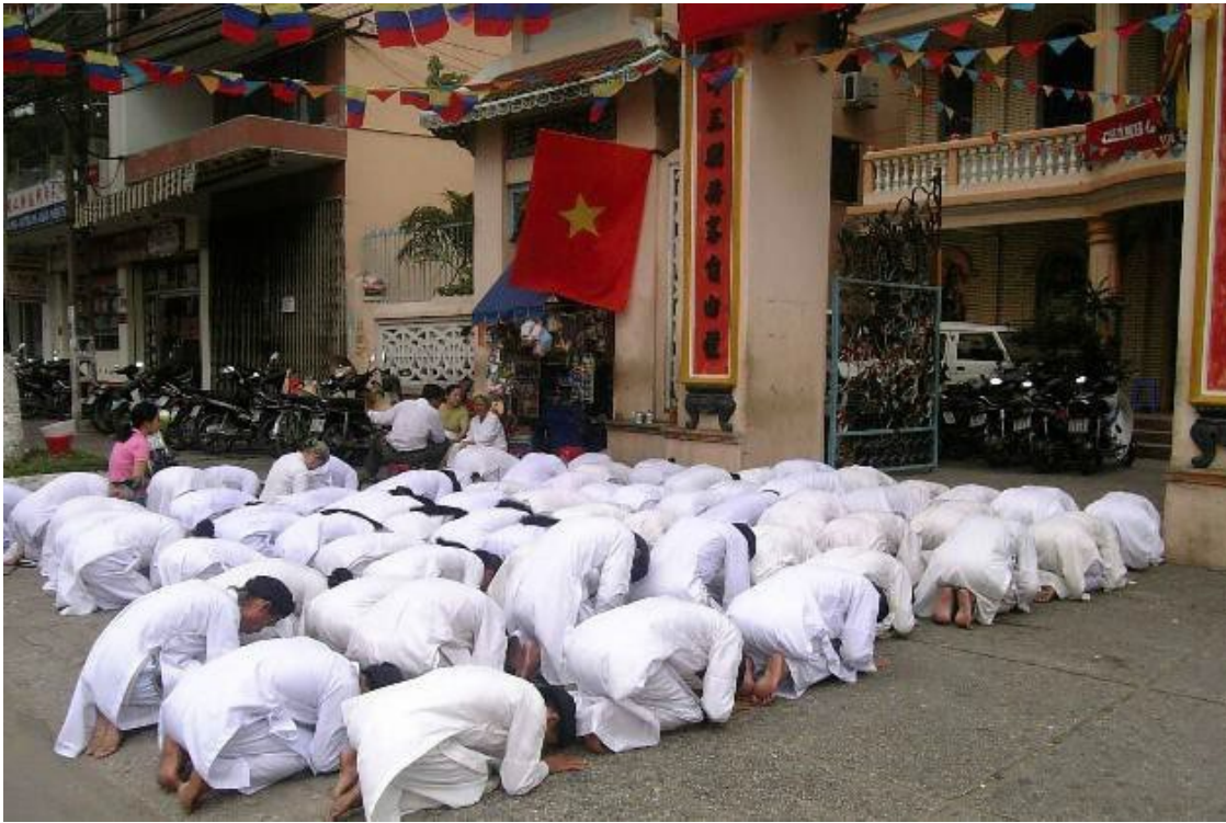
Cao Dai followers conducting prayer services on the street after their own temple had been seized and occupied by the 1997 Sect (photo taken on November 16, 2005)